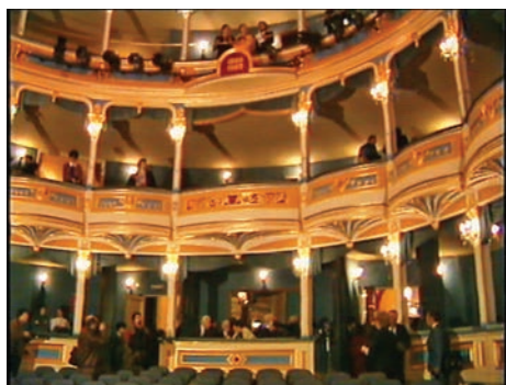
Hrvatsko narodno kazalište 1990.

„Prema podacima koje smo dobili od državne Komisije za procjenu ratnih šteta, riječ je o nešto više od 46,5 milijardi kuna”, istaknuo je Kompanović.