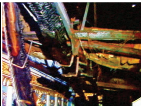
Hrvatsko narodno kazalište 1991.