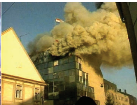
Bombardiranje samog središta grada Osijeka